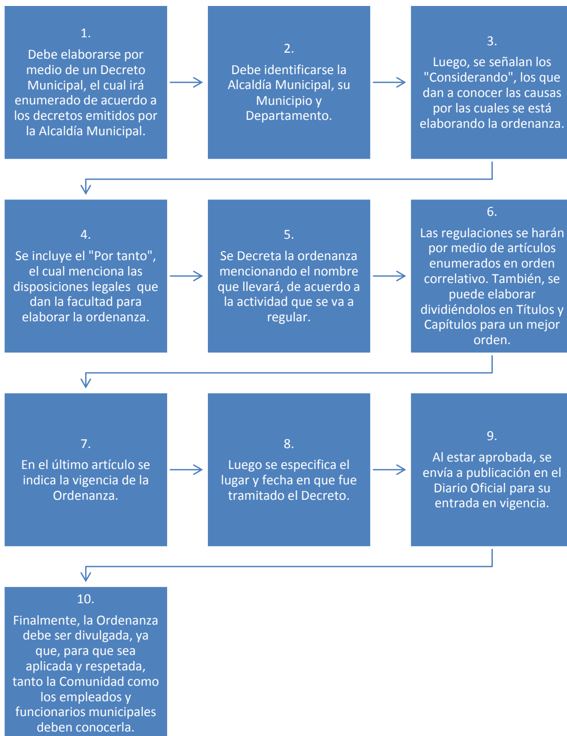
Figura 5. Pasos para la tramitación de una Ordenanza Municipal (Manual de Ordenanzas Turísticas Municipales, Región de Los Ríos, 2011).

Para que una Ordenanza Municipal sea legal, se deberán cumplir los siguientes pasos para su elaboración: