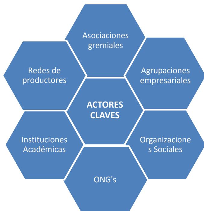
Figura 3. Actores vinculados a la actividad turística (Elaboración propia).

Es necesario convocar a los actores relevantes a una sesión de trabajo participativa que será conducida por el equipo municipal y que aportará una amplia gama de ideas, experiencias y conocimientos; y por otra parte, posibilita el desarrollo de mejores soluciones, además de oportunidades para la cooperación y coordinación, construyendo confianza entre las partes, y contribuyendo a largo plazo a la creación de relaciones de colaboración.