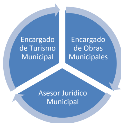
Figura 2. Equipo Motor (Manual de Ordenanzas Turísticas Municipales, Región de los Ríos, 2011).

En primer lugar es necesario conformar un grupo de trabajo al interior del municipio que se responsabilice de todas las fases y actividades inherentes al proceso de generación de ordenanzas turísticas municipales. La estructura organizacional básica del Equipo Motor se muestra a continuación: