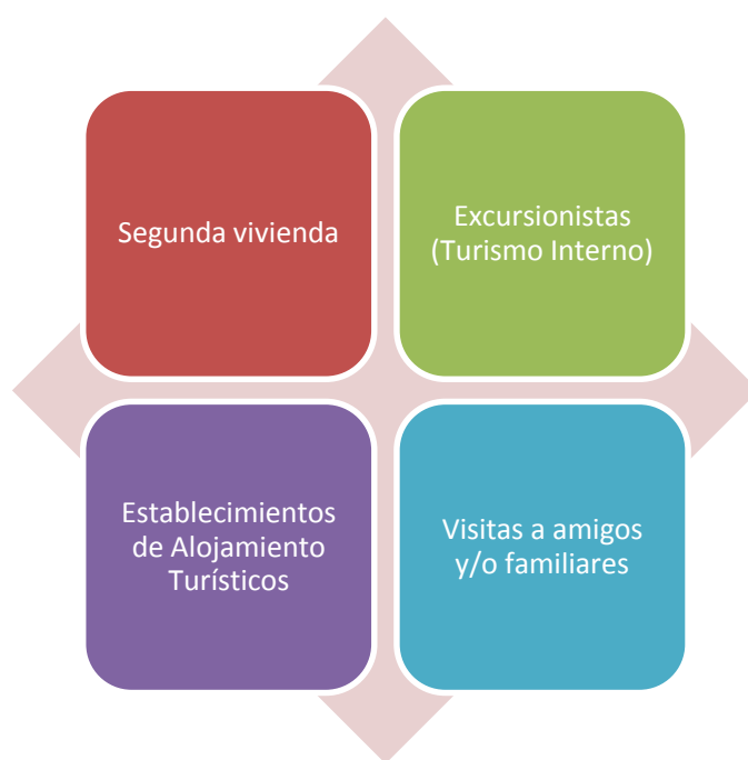
Figura 6. Variables consideradas por la Metodología de cálculo de la población flotante (Elaboración propia).

Para elaborar las fichas de ordenanzas que se presentan a continuación, se analizaron las Ordenanzas Municipales de 76 comunas de un total de 346 a nivel nacional. Para determinar esta selección se utilizó la “Metodología de cálculo de la Población Flotante” y se consideraron aquellos municipios que poseen población flotante significativa. Esta metodología considera las pernoctaciones de las siguientes variables: